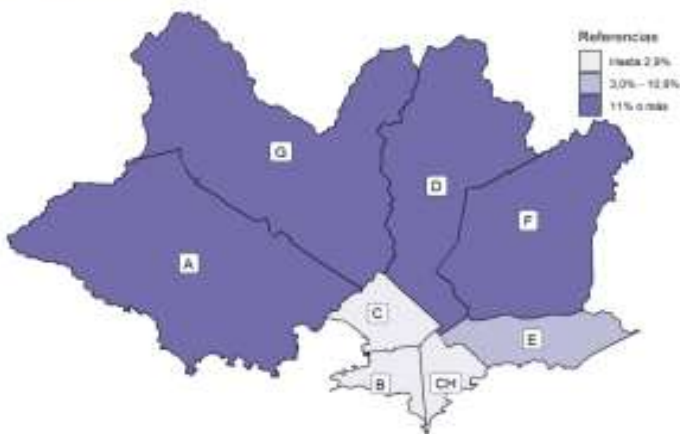
Cuadro 9: Pobreza por Municipio según edades